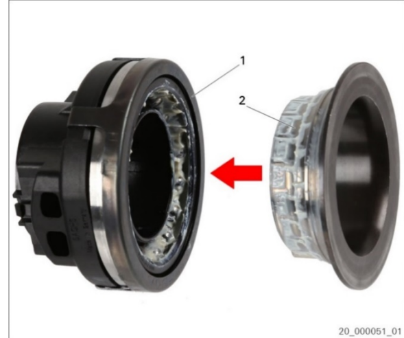
Abb./Fig. 2: Anlaufring einstecken / Insert thrust ring / montage de l'anneau d'usure / Inserción de anillo de tope