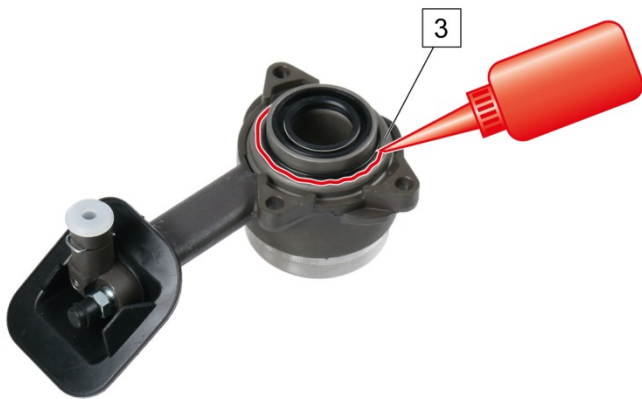
Fig. 2: Dichtmittel auf Anlagefläche (3) des CSC auftragen / Apply sealing compound to the contact surface (3) of the CSC / Appliquer le produit d'étanchéité sur la surface d'appui (3) de la butée hydraulique / Coloque sellante en la superficie de contacto (3) del CSC

الشكل 2: ضع مادة مانعة للتسرب على سطح تلامس (3) الأسطوانة التابعة متحدة المركز (CSC)