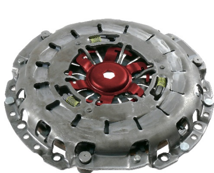
Abb./Fig. 1: Selbstnachstellende Kupplungsdruckplatte mit Verriegelungsstück

Self-adjusting clutch cover assembly with locking piece