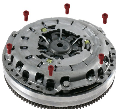
Abb./Fig. 2: Kupplung montieren

Meccanismo frizione con regolazione della compensazione d'usura dotato di elemento di bloccaggio